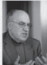
De BAM is tot nu toe een frustratie geweest.

'Ik heb dat ook gemerkt in het bedrijfsleven. Zolang mensen niet met de rug tegen de muur staan, bewegen ze niet. Ze denken dat ze de tijd hebben, en dat het allemaal zo dringend niet is. In Vlaanderen heest te sterk het