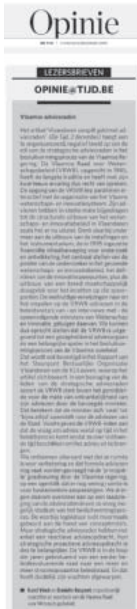
◀ artikel verschenen in De Tijd 2 december 2009

Naar aanleiding van het verschijnen van dit rapport verscheen in De Tijd (dd. 2 december) een artikel waarin de resultaten nogal ongunstiger negatief werden voorgesteld. Voorzitter Karel Vinck en secretaris Daniëlle Raspoet stuurden een reactie naar De Tijd. Deze lezersbrief verscheen in De Tijd op 8 december 2009.